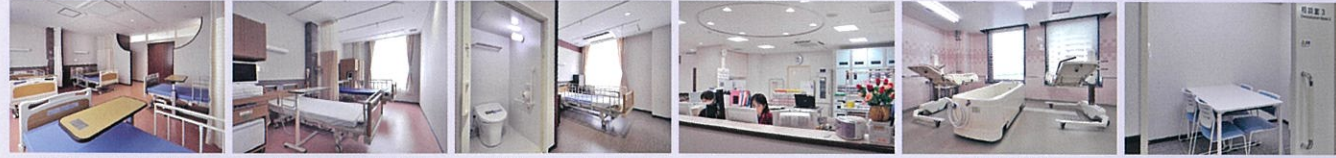
病室/4床部屋 病室/2床部屋 病室/1床部屋 ナースステーション 機械浴室 相談室