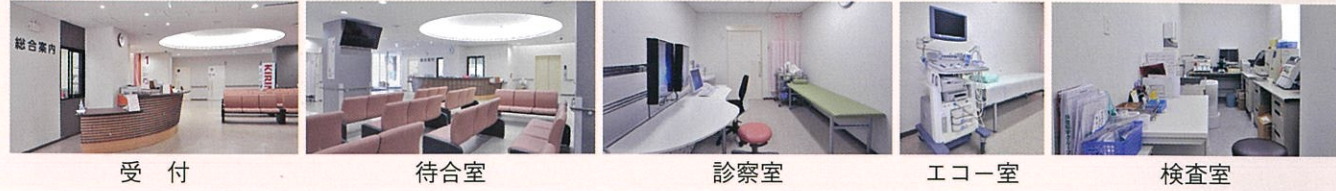
受付 待合室 診察室 エコー室 検査室